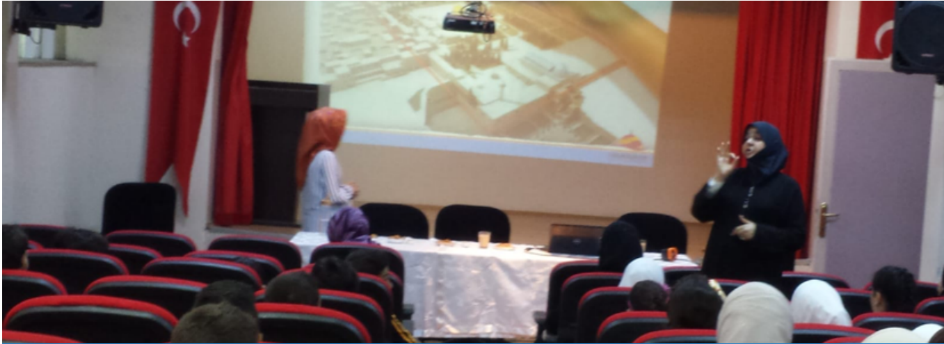
ندوات وتفاعلات داخل الجمعية